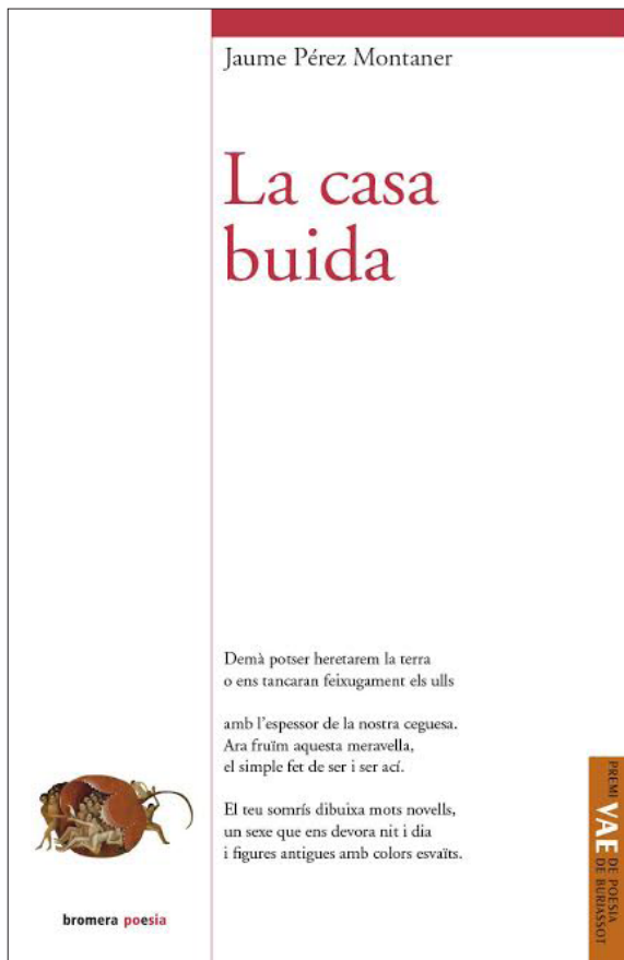
3. La casa buida, 2014.

la Serra Gelada. Potser, d'una manera més conscient, ho he fet més en aquest llibre, La casa buida i potser en altres poemes, inèdits en aquest moment, però que supose que es publicaran, supose que no tardaré massa a publicar-los. Hi ha moltes referències molt directes a l'Alfàs, que és un poble que m'agrada molt, no només l'Alfàs sinó la Marina Baixa i la Marina Alta, les dues Marines que jo pense que haurien de ser una única Marina. En aquest llibre "Assaig", per exemple, em porta records de Benimantell; "Racó de l'Albir" o "Capvespre a La Vila" són ben evidents; "Serves, magranes" i "Una casa buida" em parlen de L'Alfàs. I altres poemes em porten records de diversos indrets de les Marines, el Comtat i l'Alcoià.